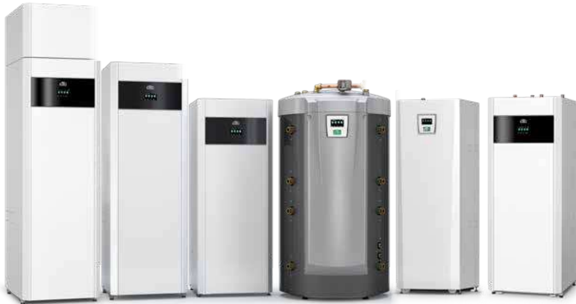
CTC EcoVent i360F

– kijk voor meer informatie op de respectievelijke productfiches.